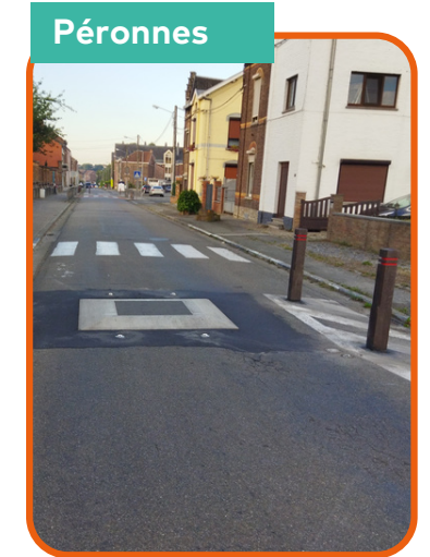
Remplacement du dispositif de ralentissement (coussins berlinois, potelets et marquage) à la rue Joseph Wauters