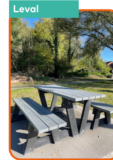
Installation de mobilier urbain au Bois de la Case