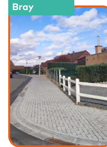
Réfection des trottoirs à la Résidence des Fosses