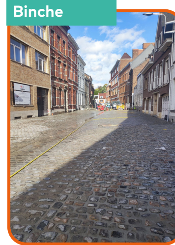
Pavage à la rue de la Régence

Réfection de trottoirs, rénovation de voiries, entretien des cimetières, nettoyage des avaloirs, verdurisation, travaux au sein des écoles,... sont autant de chantiers qui sont réalisés au sein de notre entité. Certains travaux sont en cours, d'autres sont terminés et d'autres vont voir le jour. Nous vous présentons les différentes réalisations.