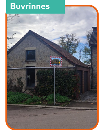
Remplacement d'un miroir routier au carrefour de la rue de Cent Pieds/rue Balenfer