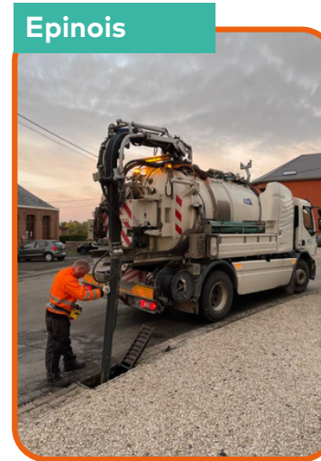
Entretien et curage des avaloirs à la rue du By