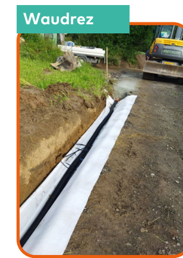
Intervention à la voie Miclette : pose d'un drain, création d'un fossé, pose d'un tuyau PP du fossé vers la ZIT à proximité du RAVel afin de rediriger les eaux en cas de fortes pluies