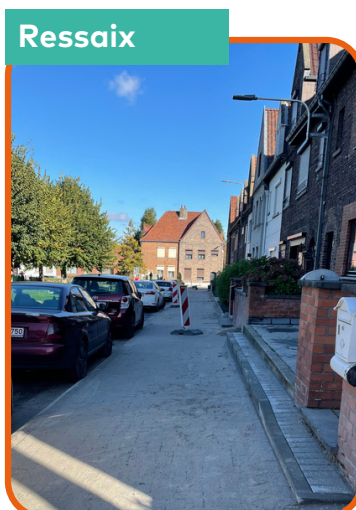
Rénovation des trottoirs à la rue des Tagètes, Oeillets et Violettes